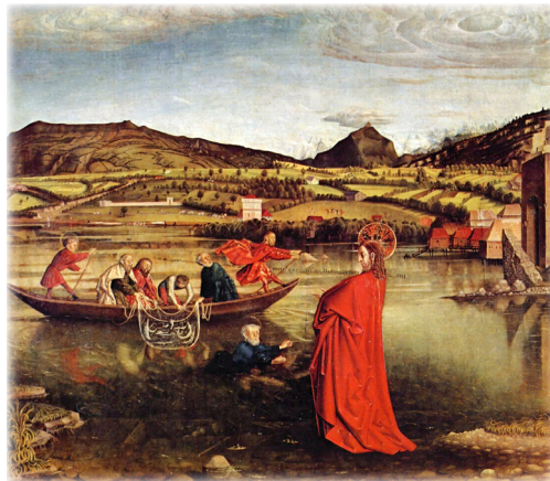
Konrad Witz, retable de la cathédrale Saint-Pierre de Genève, 1444.

Les âmes qui appartiennent à l'une ou l'autre de ces groupes non catholiques possèdent certains éléments, plus ou moins nombreux, de la vraie et unique Eglise. Ces âmes doivent nous être chères. Nous devons beaucoup prier pour elles. Pour qu'elles arrivent à la sécurité de la seule Arche de salut. C'est ce qu'ont fait tous les saints : la charité de la vérité, l'apostolat du bon Pasteur qui ramène les brebis égarées. Genève et les régions voisines retentissent encore de l'oeuvre admirable qu'y accomplit l'intrépide saint François de Sales. Grâce à lui, des milliers de protestants sont revenus au Bercaïl.